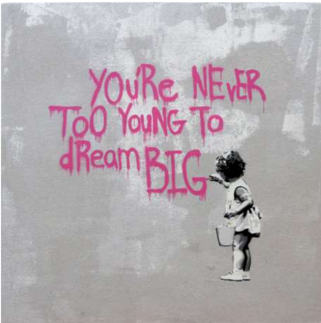
Hijack Never Too Young To Dream Big - Pink Grey 2013 Spray Paint on Canvas