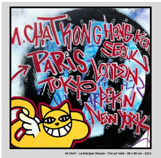
M.CHAT - La Marque Chaune - Tmi sur toile - 90 x 90 cm - 2013

M. CHAT est une création graphique de l'artiste Thoma Vuille (né en 1977). Artiste incontournable de la scène Street art, Thoma Vuille a marqué les capitales européennes et mondiales de sa patte en créant M.CHAT au début des années 2000, un des personnages les plus connus de la vague graffiti.